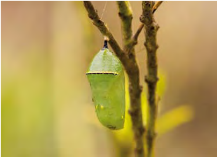
Aus der anfangs grün gefärbten Puppe entwickelt sich innerhalb weniger Tage der Falter.

Wird dann einmal ein Individuum von einem Vogel gefressen, geht es diesem danach eine Zeit lang so schlecht, dass er es nie vergisst. Damit die Vögel es sich auch gut merken können, sind die Falter, vor allem aber deren Raupen, zur Warnung so auffällig gefärbt. Diese farbliche Warnung ist derart erfolgreich, dass sie sogar von nicht giftigen anderen Falterarten nachgeahmt wird, die so gleichfalls von diesem Schutzschirm profitieren.