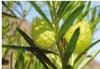
Monarchs Leibgericht: Der Schwalbenwurz

den. Auf den Kanaren vollziehen die Monarchfalter derartige Wanderungen allerdings nicht. Man könnte annehmen, dass sie die kühleren Wintermonate ruhend in Unterschlüpfen wie beispielsweise Felsspalten verbringen oder auch von den anderen, während des ganzen Jahres pflanzenreicheren Inseln, immer wieder neu einfliegen. Die Monarchen sind äußerst flugstarke Falter. Mit kurzen Flügelschlägen und über lange Strecken segelnd können sie rasch größere Entfernungen zurücklegen. Beutegreifern aus der Vogelwelt weichen sie durch schnelle Wendungen geschickt aus. Diese Fähigkeiten haben ihnen geholfen, sich im Verbund mit