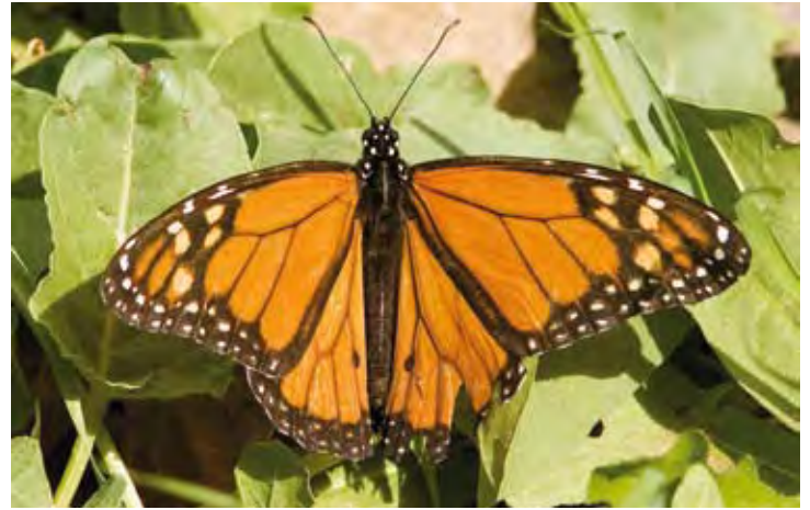
Ältere Falter erkennt man an den Verletzungen und Kratzern der Flügel.

wenigen Hektar Fläche die Winterzeit. Wie Forscher gerade erst feststellten, finden sie ihren Weg mit Hilfe eines in ihren Fühlern befindlichen Sonnenkompasses. Im Überwinterungsgebiet angekommen, legen sie in dichten Trauben, in und an Bäumen hängend, hier eine energiesparende Ruhephase ein. Bemerkenswert sind die Umstände der Rückkehr der Falter. Es sind nämlich nicht wie bei Zugvögeln dieselben Individuen, die sich wieder im heimatischen Lebensraum einfinden. Vielmehr erfolgt die alljährliche Rückwanderung durch mehrere Generationen, die sich auf ihrem Weg nach Norden nacheinander in unterschiedlichen geographischen Gebieten entwickeln. Auf den Menschen übertragen bedeutete dies, dass nach einer Raumfahrt zu einem fernen Planeten erst die Enkel derjenigen Astronauten, die die Erde verlassen hatten, zurückkehren wür-