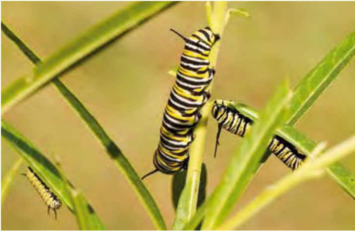
Die gefräßigen Raupen warnen Fressfeinde durch ihre auffällige Färbung.