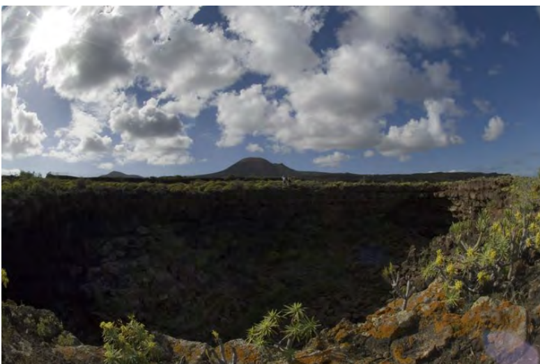
Abb. 3. Der erloschene Vulkan Monte Corona auf der Kanarischen Insel Lanzarote. Im Vordergrund sieht man einen Abschnitt des Lavatunnels mit eingestürzter Decke.