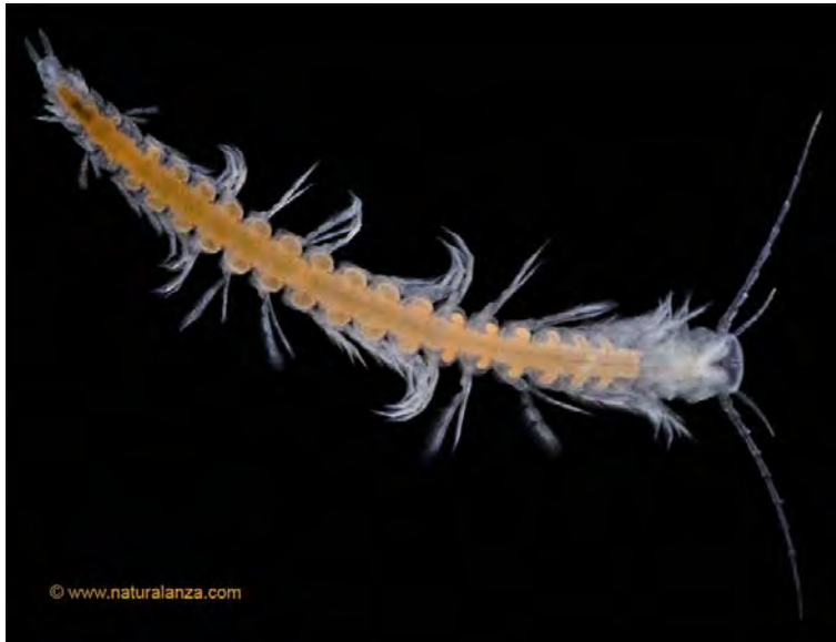
Abb. 4. Ein lebendes Exemplar der neu entdeckten Art augenloser Grottenkrebse, Speleonectes atlantida . Foto © Ulrike Strecker (www.naturalanza.com).