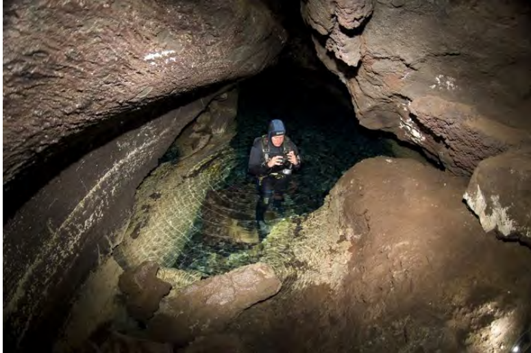
Abb. 1. Taucher in der untermeerischen Lavahöhle auf der Kanarischen Insel Lanzarote.